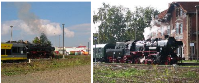
Sonderfahrt der Leipziger Eisenbahnfreunde am 7. Oktober 2007.