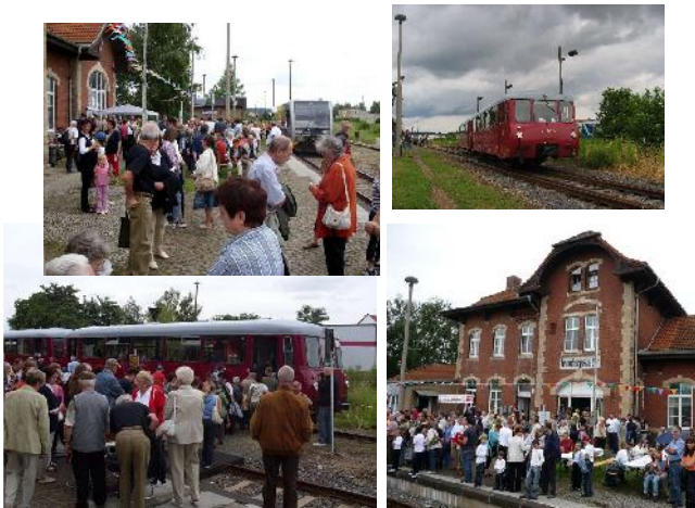
Großer Andrang und viel Interesse beim Bahnfest 2009

Helfen Sie mit, unsere Strecke zu erhalten! Unterstützen Sie die Aktivitäten der IG Unstrutbahn!